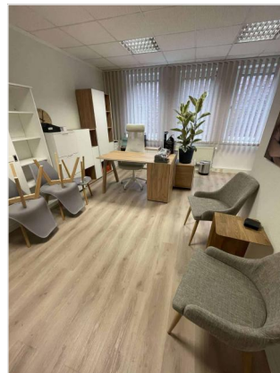
Empfang/ Büro 1