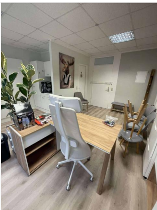
Empfang/ Büro 1