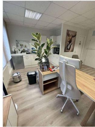
Empfang/ Büro 1