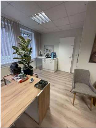
Empfang/ Büro 1